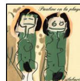
Silabario (Subterfuge Records)