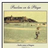
Nada como el hogar (Subterfuge Records)